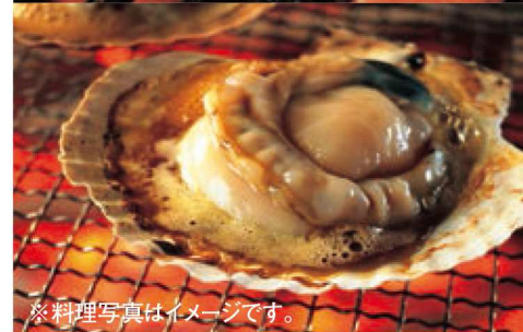
※料理写真はイメージです。